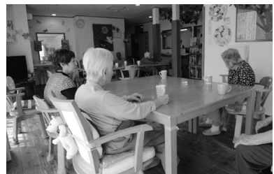
グループホーム こもれび家族 東京都府中市是政2-19-1 H18年9月開設 入所者18名

調湿作用について 「梅雨時分でもジメジメ感はありません。廊下の手すりに洗濯したタオルを並べて干すことがあるのですが、エコ・クイーン を施工したこのホームでは2時間ほどで乾きます。一方、小平市と国分寺市のホームでは、6時間経っても乾きません。調湿力のある建物と、まったく調湿力のないビニールクロスと新建材でできた建物との差がはっきりとわかります。」