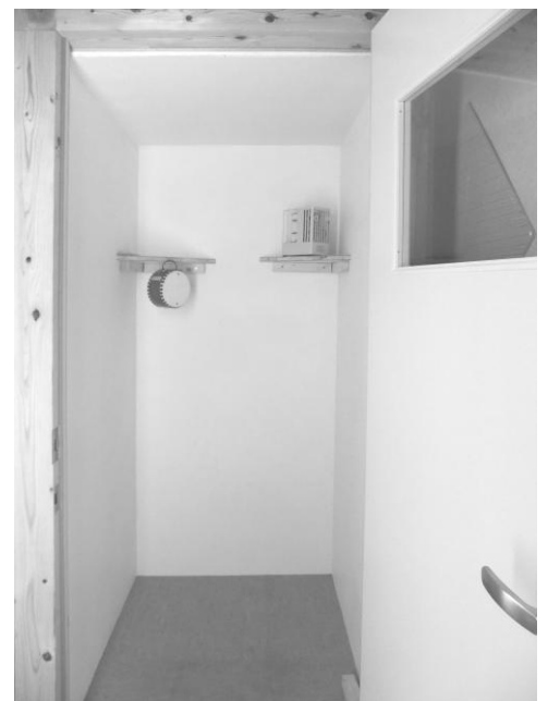
「NSR-5を施工した部屋」の内部。 温湿度記録計と太鼓を置いています。

向かって左側が「ビニールクロスを貼った部屋」、右側が「NSR-5を施工した部屋」。